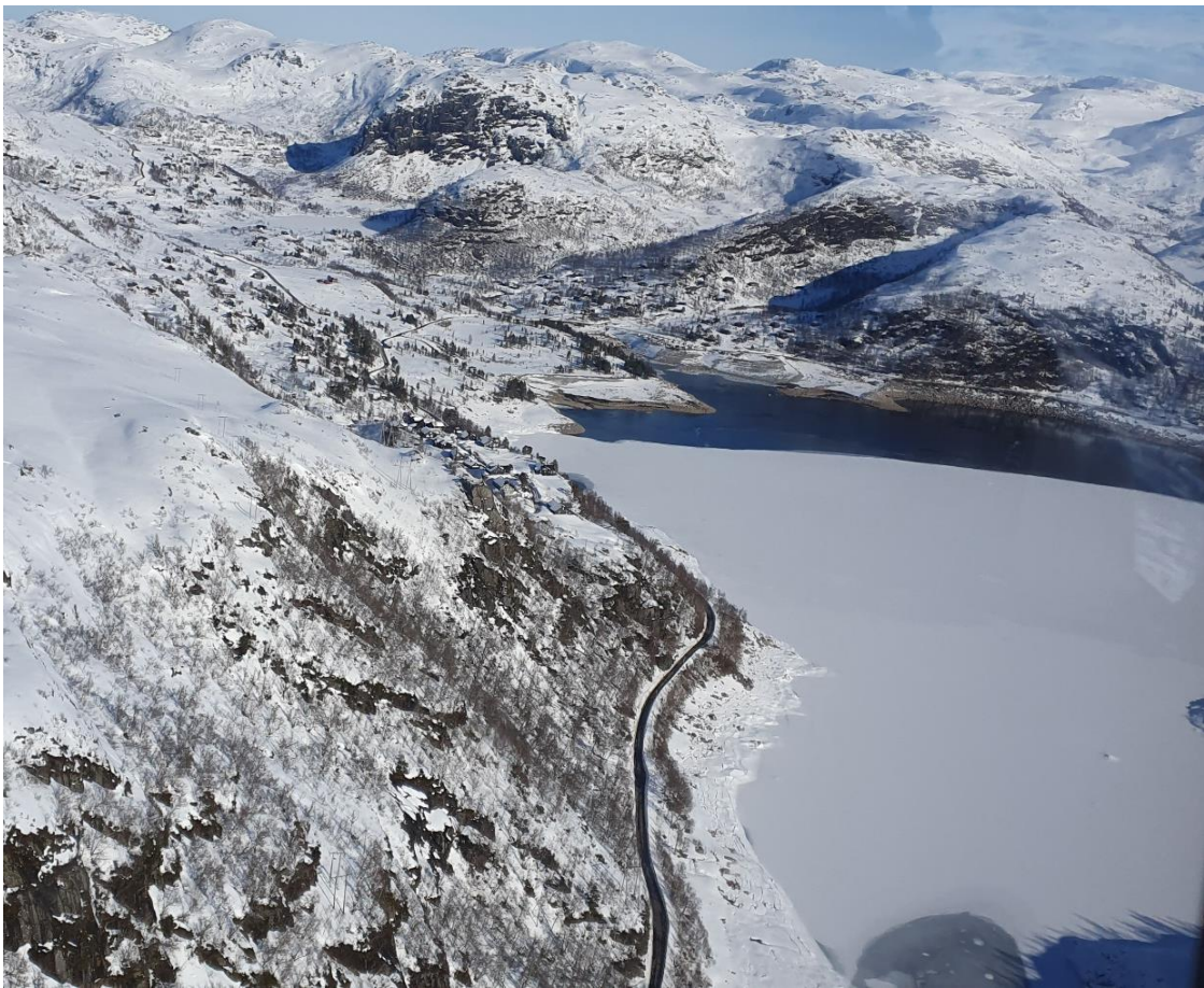
Figur 3 Stordalsvatnet sett fra sør-vest siden mot nord-øst. Utløp av tunnel fra Årsdalsvat-Tverrvatn utenfor neset der det er åpent vann. Foto tatt 2. mars 2023, Bjørn Batalden.