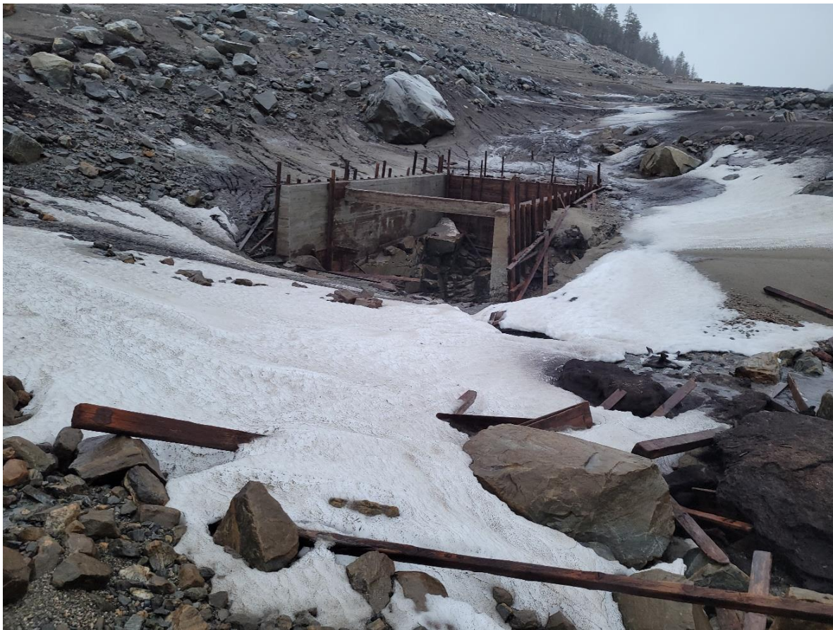
Figur 1 Utløpet av tunnel fra tunnel fra Årsdal-Tverrvatn. Materialer fra forskalingen skal nå fjernes.

Det er nødvendig å holde magasinet ned under HRV i intill 14 dager for å få utført de planlagte arbeider. Uten tilsig tar det ca 2 dager å kjøre ned magasinet. Med tilsig kan det ta 4 dager. Vi ønsker ikke å starte tappingen tidligere enn nødvendig og vil planlegge starting av tapping etter værprognoser er kjent, slik at ønsket vannstand på kote 440,0 kan nås mandag 17.april. Tapping av magasinet vil da ikke starte før etter årets påskeferie. Magasinet senkes ved å kjøre vannet ut via Matre-Haugsdal kraftverk.