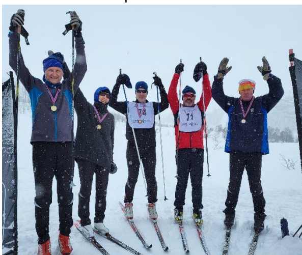
Figur 1 - Den eldre garde som deltok på klubbmesterskapet i Stordalen

Takk til alle som har delteke på renn, nytta løypene og vist god løypekultur.