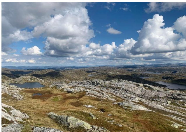
Bilete tatt frå Svadfjellet mot Stordalen