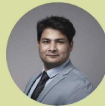
Muhammed Ismail Shah Technology Centre Mongstad