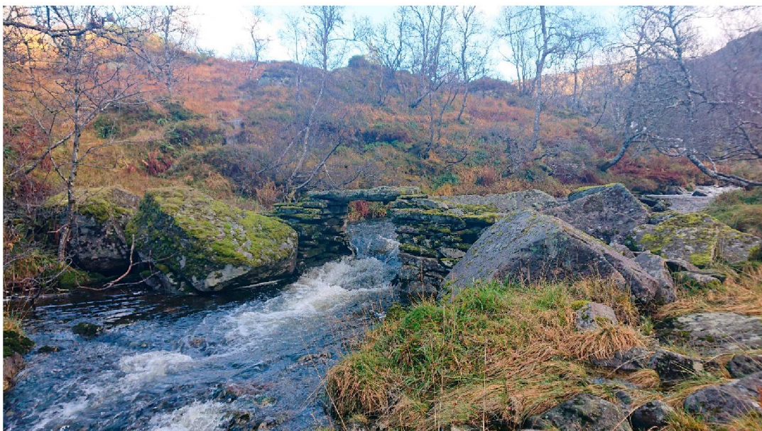
Broen sett i retning vatnet i nordøst

Vegen starter ved bosetningsområdet Treet id.150447, og går i østsiden av dalen i skrått terreng. Vegen er flere steder bygget opp med muring, i nedre deler er det også en del bakkemurer. Noen styvingstrær står nedenfor anleggsvegen som er bygget i ny tid. Helt nede er del av mur etter et kvernhus synlig.