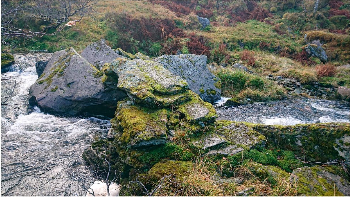
Broen sett fra nordsiden. De to hellene er bort imot 2 meter lange.