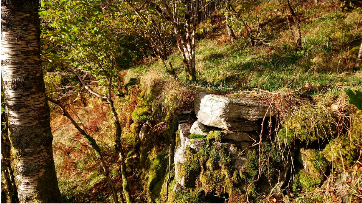
Bakkemur (32V 314429 6755594)