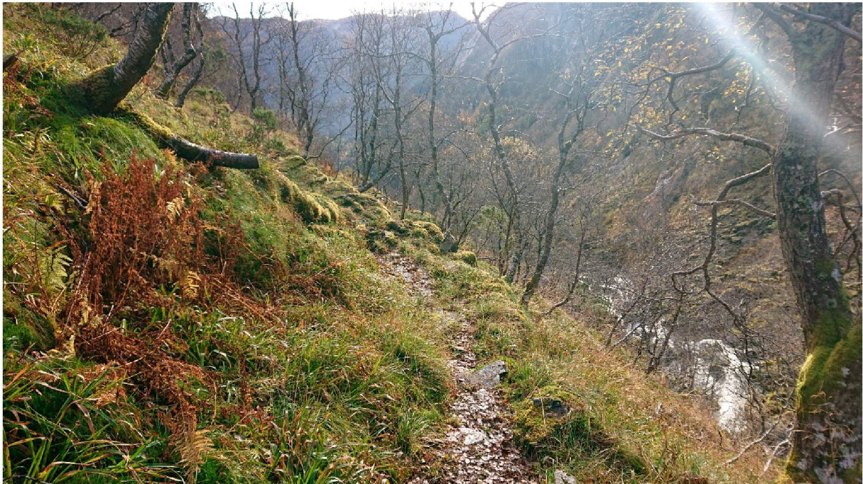
Parti i vegen sett nedover dalen/sør