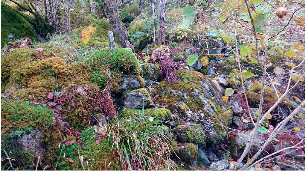
Del av muren til kvernhus noen meter vest for den nye vegen. En stakk står opp i et hjørne. (32V 314547 6755318)