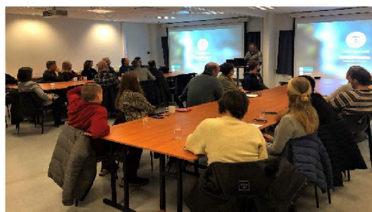
Om lag 25 bønder frå Gulen og Masfjorden deltok på samlinga.