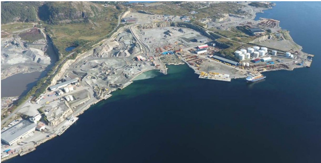
Gulen Industrihamn.