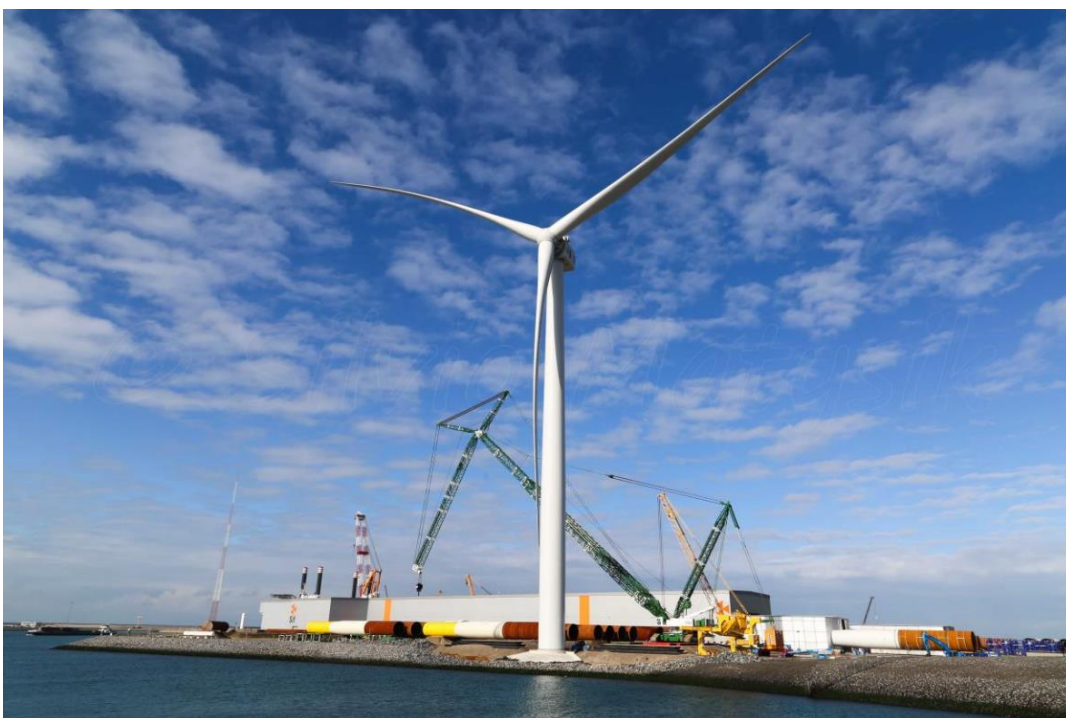
Bilde som viser tilsvarende turbin; GEs testturbin (Haliade-X 12 MW) i Rotterdam havn.