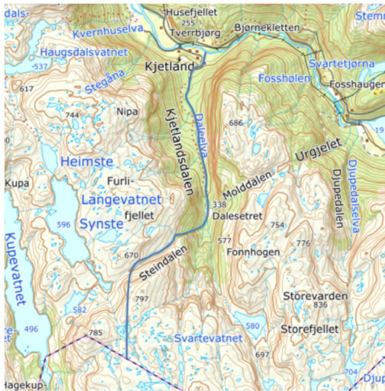
Vald/jaktfelt 4634V0061 Kjetland, grensen følger Daleelva opp til Dalesetret der elva deler seg i tre.