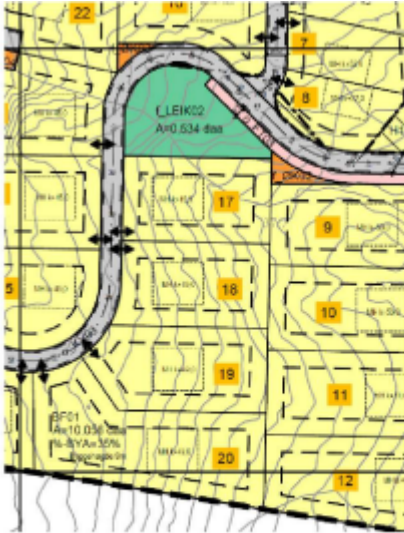
Figur 8: Gjeldande reguleringsplan der tomt 17 - 20 har avkørsler ut i o_KV03.