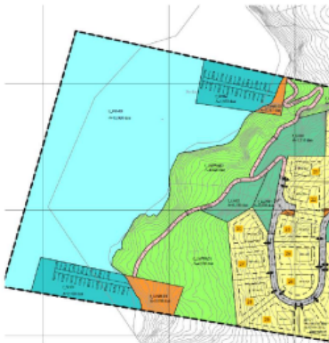
Figur 4: Gjeldande plankart.

Nedunder vert kartendringa knytt til småbåthamna vist :