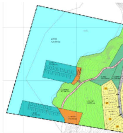
Figur 5: Forslag til endringar i plankart der småbåthamn i nord er flytta lenger sør.