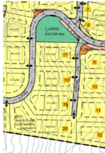
Figur 9: Foreslått endring. Etablering av o_KV05 som gjev tilkomst til tomt 17-20.

I tillegg er det gjort små justeringar som følgje av desse tre endringane. Det vert vist til vedlegg i saka som skildrar dette nærmare.