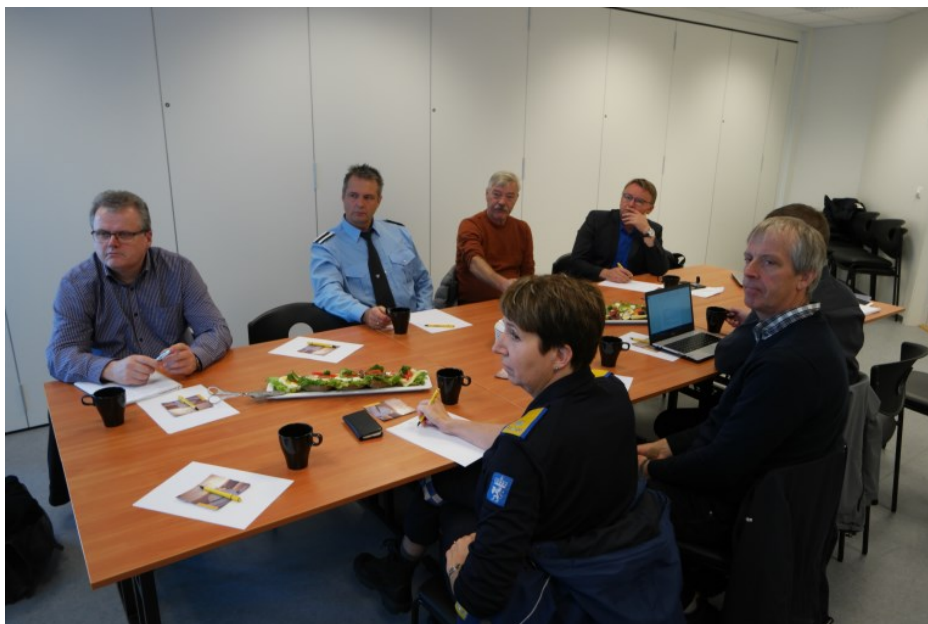
Møte om kartlegging av behov. Deltakarar var fylkesmannen, Norges brannskole, Sivilforsvaret, nabokommunar, lokalt næringsliv, m.f.

Utover dette er det fleire av brannvesena frå omkringliggjande kommunar som treng øvingsfasilitetar for å få lært opp og øvd sine mannskap.