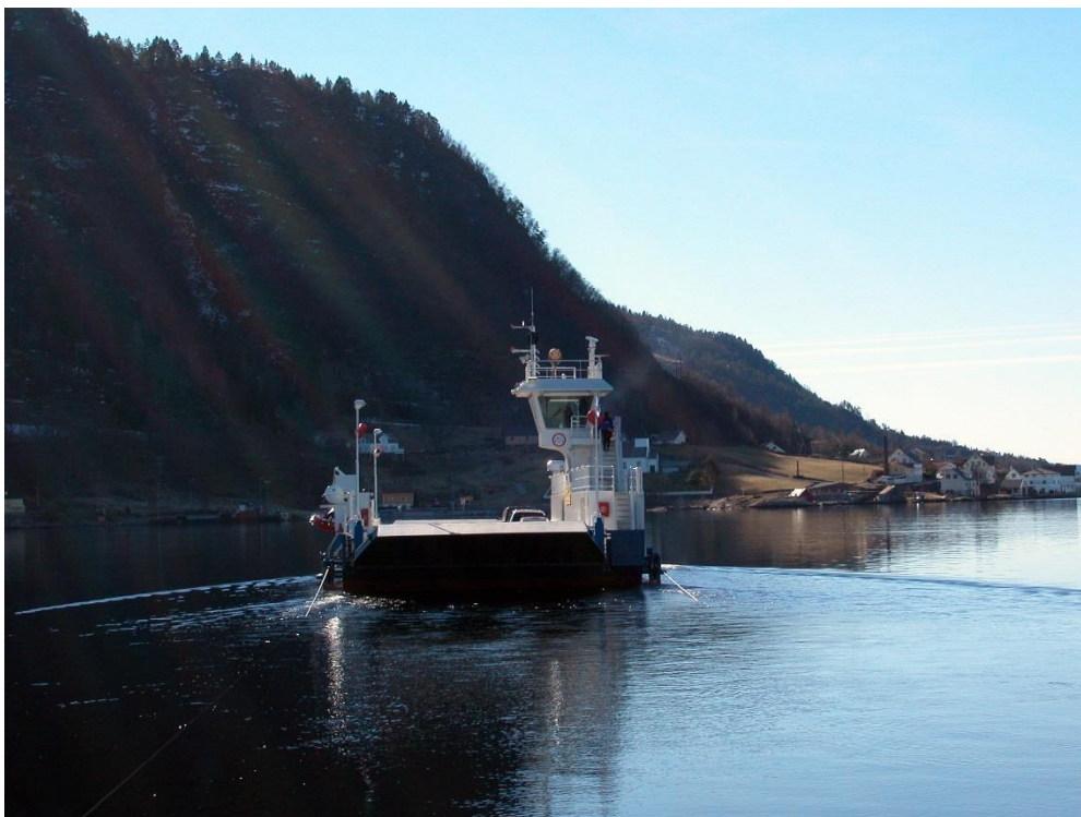
Figur 1: Kabelferjen Fjon–M på veg over Masfjorden.

Kommunehuset ligger på Masfjordnes ved fjordens munning, der kabelferjen Fjon–M ble satt i drift på ferjesambandet fv. 570 Masfjordnes–Duesund våren 2002. Ferjen kan frakte 21 personbiler, evt. to vogntog og 14 personbiler. I 2016 fraktet ferjen 158 kjøretøy per døgn over Masfjorden.