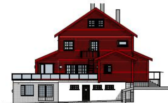
1:200 Fasade øst