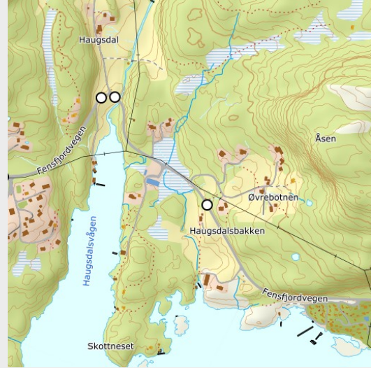
NVDB – ulykker (1000m x 1000m)