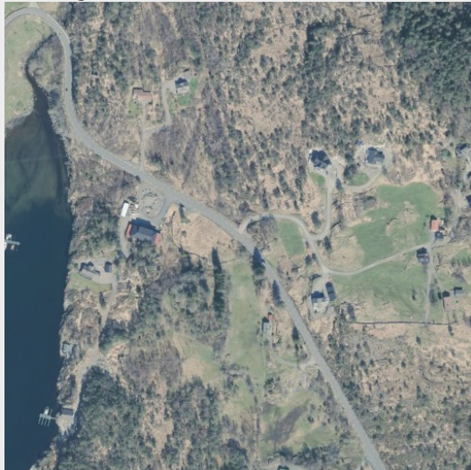
Geonorge – Ortofoto (500m x 500m)