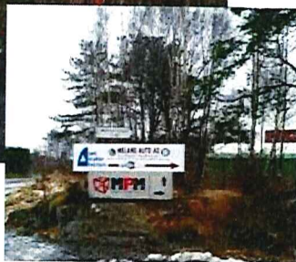
Dette er bare for å vise, størrelsen er ikke 1/1.