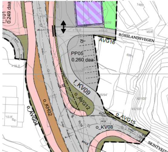
Utsnitt – Detaljregulering for Bergotunet: