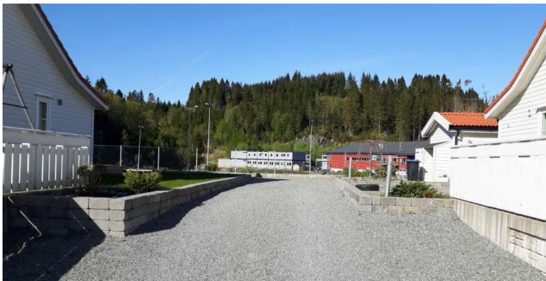
Fossemyra sett frå Tua per dags dato