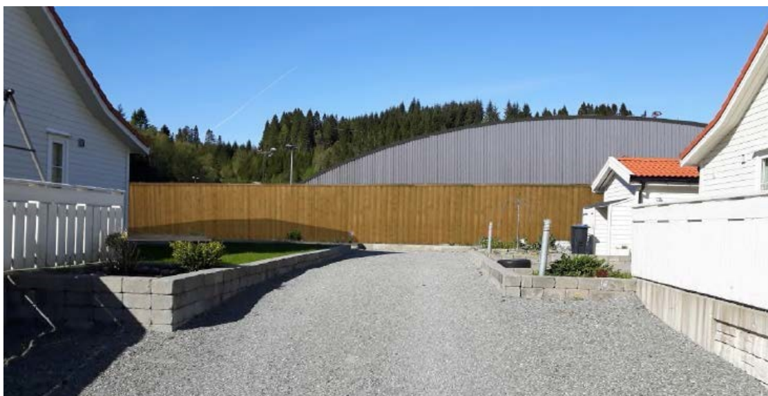
Fossemyra sett frå Tua med støyskjerming og idrettshall

Bustadene i Tua ligg på eit platå ca 5 m høgare enn Fossemyra og den nye hallen vil då vise 9 meter over planert terreng her. Illustrasjonane syner at utsikta vil endre seg. Då husa på Tua er vendt mot sør-vest og har det meste av utearealet vendt denne vegen, vil tiltaket i størst grad forringe utsikta frå bakhagen.