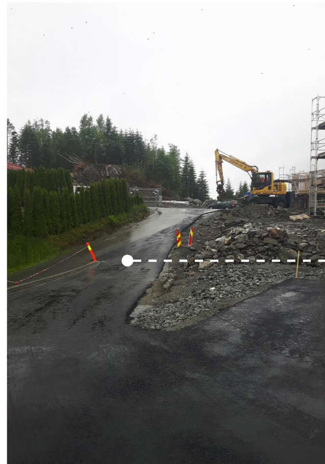
Det er laget til en slak og fin adkomst til PP01 fra KV05