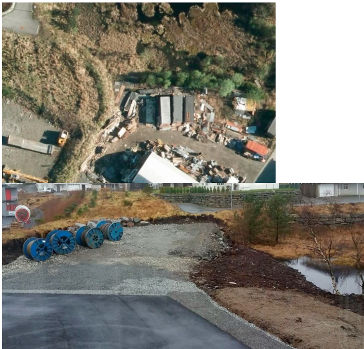
Situasjonsbilde viser omsøkt areal, 2015 og 2017.

I reguleringsføresegna 6.2.1 står det at tiltak som har negativ konsekvens for naturområde på land og i vassdrag blir ikkje tillette. Rådmannen vurderer at det oppryddingsarbeidet som er gjort i området har vore til fordel for naturvernområde, og at omsøkt tiltak ikkje set intensjonen bak formålet vesentlig til side. Tiltaka Kolos Eigedom AS har utført har vore meir til fordel enn ulemper. Store deler av området rundt Mjåtveittjerna og i Mjåtveittjerna har blitt reinska og rydda.