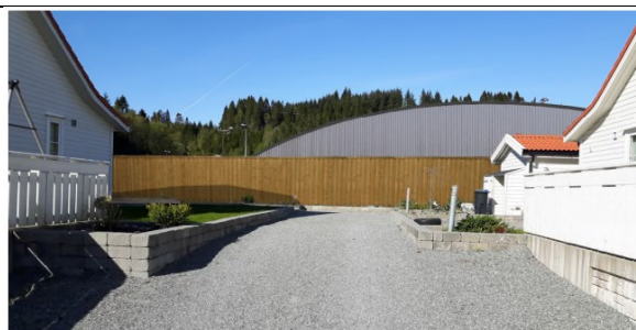
Figur 27 Same utsikt med planlagd idrettshall (og støyskjerm).

På s. 28 er det prøvd å illustrere korleis hallen vil prege utsikta etter at gjerde på 2m er sett opp. I forhold til dei teikningane som føreligg stemmer ikkje denne illustrasjonen. Dersom ein ser på side 29 går det fram at hjørnet på hallen ligg midt mellom Sagstadvegen 99 og 101.