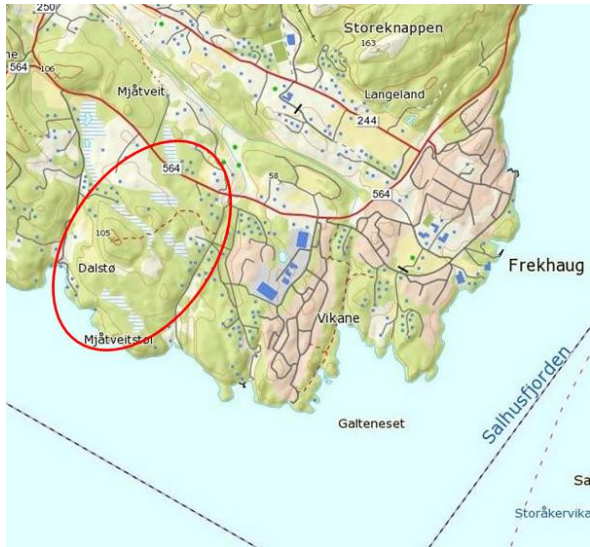
Oversiktskart, raud ring syner planområdet