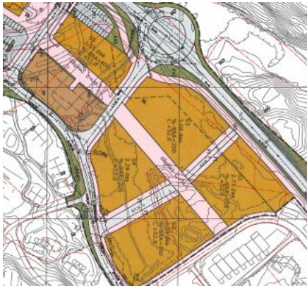
Illustrasjon over område som inngår i områdereguleringa Langelandskogen

Det er fleire tema som peiker seg ut som må sjåast i samanheng i det vidare planarbeidet. Vi må planlegge for attraktive sosiale møteplasser og eit robust og variert offentleg/privat tenestetilbod. Det er i økonomiplanen (vedteke i KS. SAK 73/2016) sett av midlar til å planlegge ny kommunal barnehage og ny ungdomskule i 2017/2018 og bustader særskilt tilrettelagt for heildøgnsstenester.