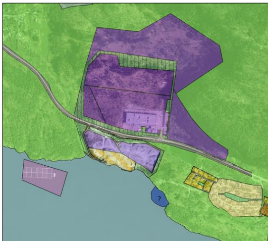
1 Kart over tilgrensande areal

Fabrikkområdet til Framo Holsenøy AS regulert i Reguleringsplan for Hjertås Nord, PlanId 1256 2005 0316. I vest grensar planområdet til LNF, i nord og aust er omkringliggjande areal sett av til framtidig næringsverksemd i kommuneplanens arealdel. I sjø er det regulerede områder for akvakultur, fiske- og låssettingsplass samt Forsvarets forbodssone som går i strandlina.