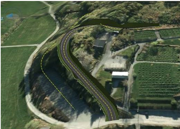
Skisse ny tilkomstveg til gravplassen

I etterkant av moglegeheitsstudia er ny tilkomstveg nærare utgreidd, og det vert anbefalt å utbetre eksisterande veg basert på grovskissa vist under: