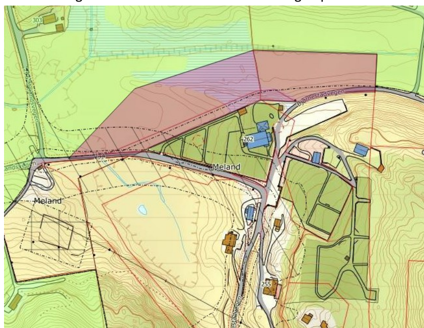
Nytt areal til gravplass i kommuneplanen sin arealdel 2015 vist i raudt

I kommuneplanen vart det i 2015 satt av eit nytt areal til gravplass nord for kyrkja. Arealet er relativt flatt og ligg nær kyrkja. Området vart vurdert som godt tilgjengeleg, og ville ikkje gje problem med bratt terreng slik som er tilfelle for eksisterande gravplass.