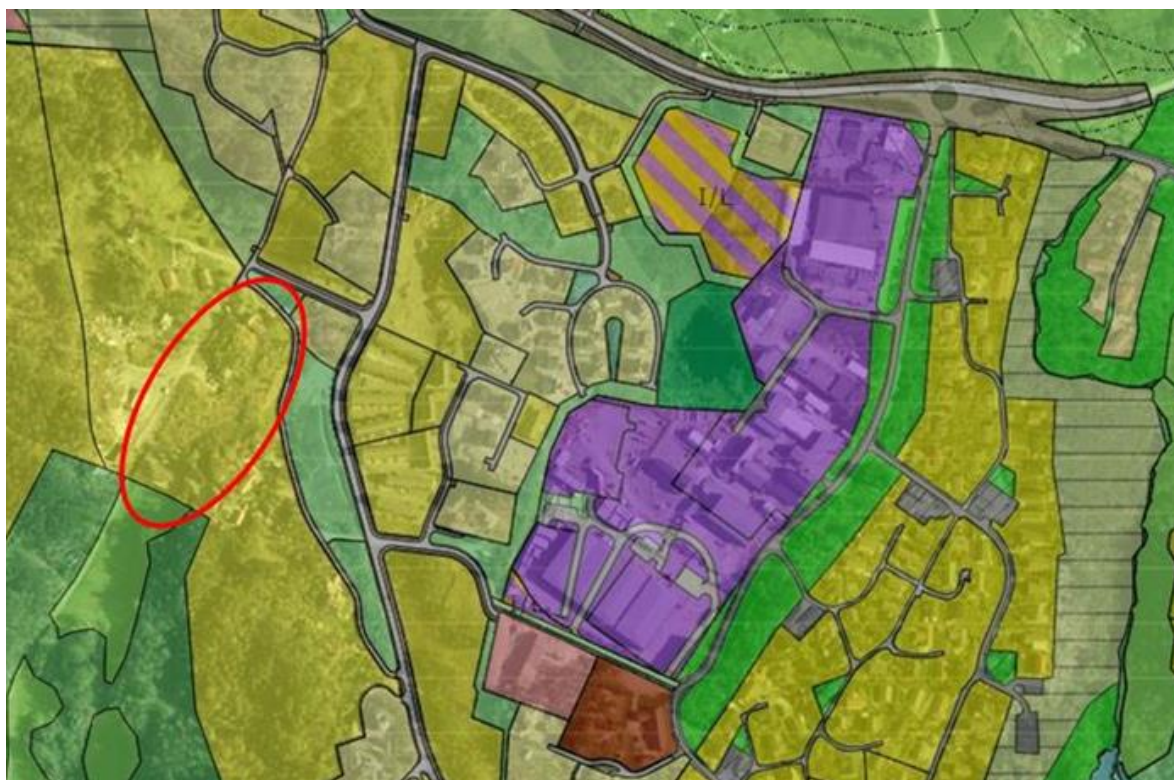
Utsnitt syner forholdet til KPA og tilgrensande reguleringsplan Mjåtveitmarka