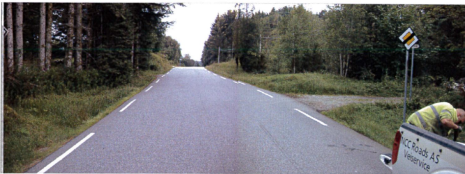
Det er ikkje stigning/helling rett ut frå vegkant (vegfilete frå Google og Statens vegvesen).