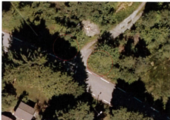
Det tekniske kravet til svingradius på 4 meter er vist med raude sirklar i flyfoto.