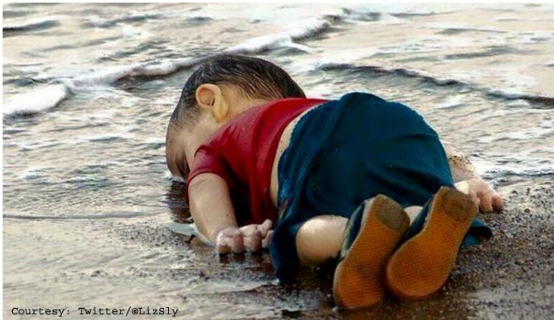
Alan Kurdi September 2015

«(...) Dersom et enkelt barn blir myrdet, så kan det ryste et helt land, ja en hel verden. Men når tusener av barn blir myrdet så gjør det langt svakere inntrykk. Hvorfor? Fordi individualismen blinder oss.» (Tore Vagn Lid)