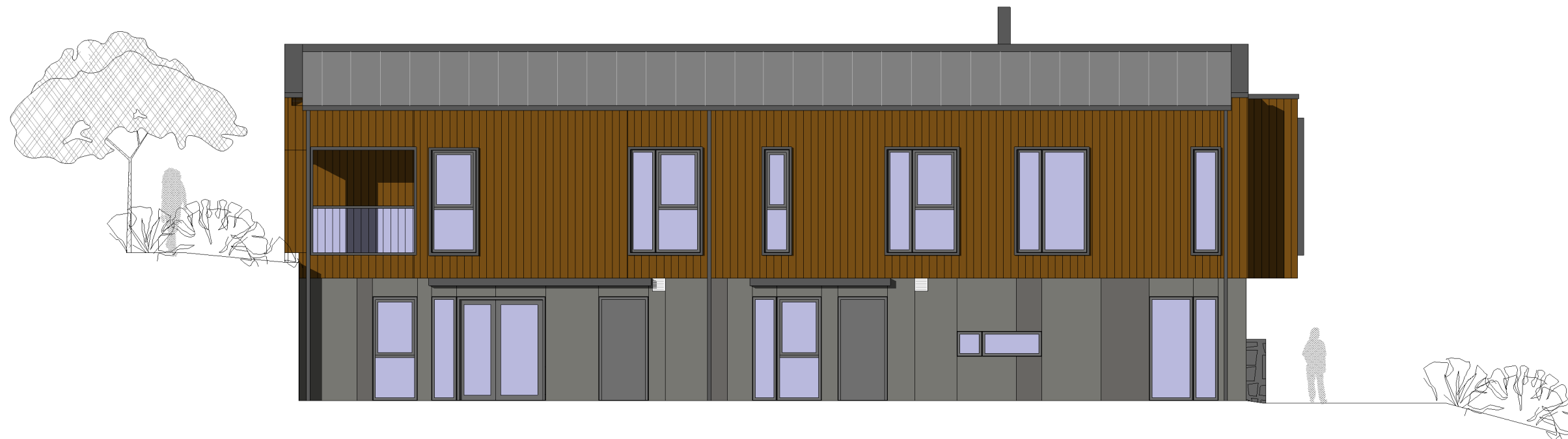
FASADE MOT NORD