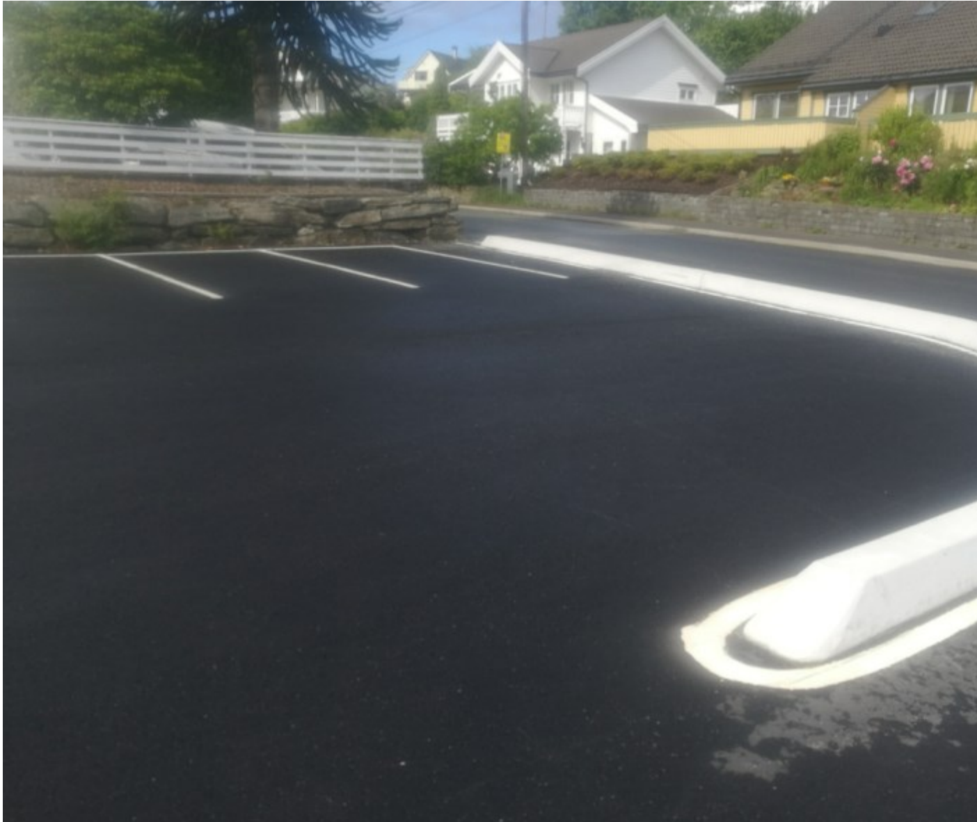
Bilde av sikt i mot sør vest, mur og gjærde som står i sikt sonen kan sees oppe på bildet. Samt biler parker midt i sikt sonen.