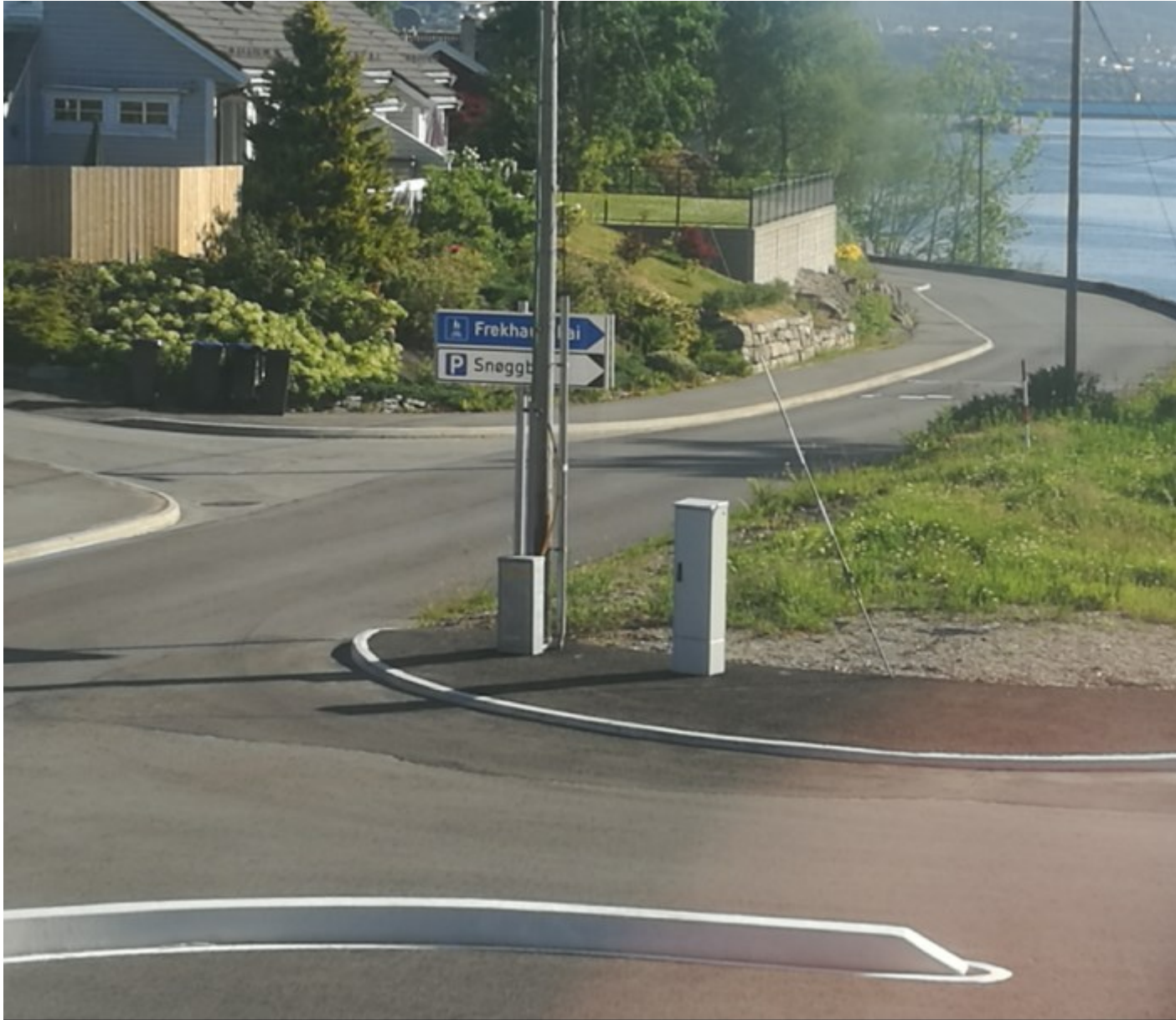
Pareringsplassen er ikke skiltet for friområdet.