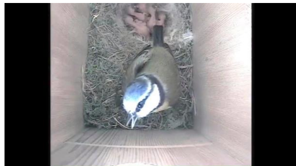
Nyfødte Blåmeisbarn i vår digitale fuglekasse.