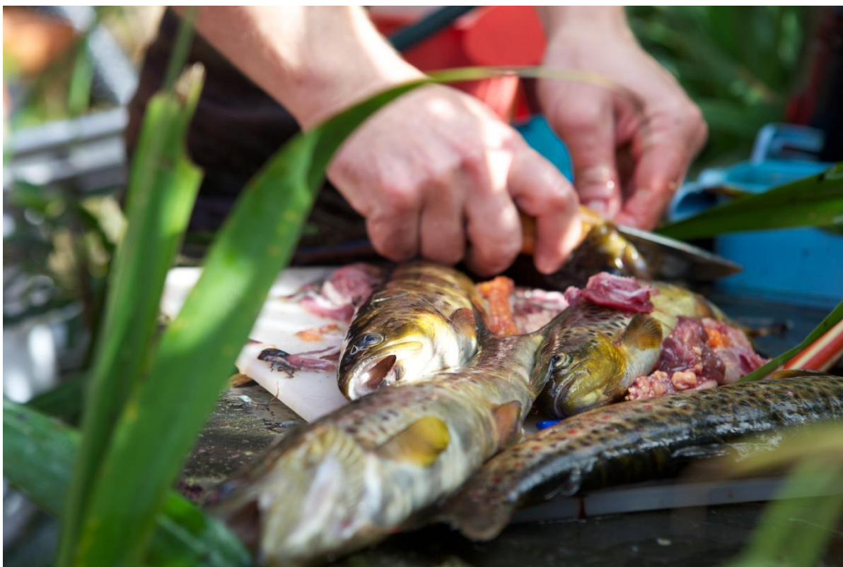
Fisk frå Rylandsvassdraget.