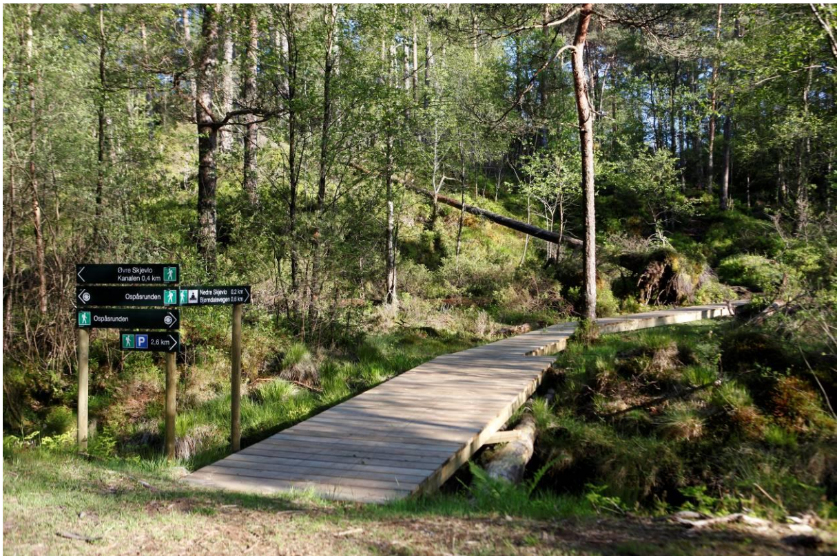
Frå Skintveitmarka.

Gjennomføring av tiltaka krev midlar. Det er her ikkje mogleg å setje faste kostnadskalkylar på slike parkeringsplassar, både grunna ulike nivå på standard frå prosjekt til prosjekt og kva for grunnforhold som gjeld på dei einskilde plassar. Planen legg opp til at gjennomføringa kan gjerast både av kommunen og private. Kostnadar ved ekstra parkeringsplassar ved kommunale anlegg må inn i økonomiplan investering. Er utbyggjar grunneigar eller frivillige/ideelle aktørar vil eit kommunalt bidrag måtte vere aktuelt i form av tilskot, noko som må inn i økonomiplan drift. Planen legg ikkje opp til at kommunen må eigna til seg grunn, men heller inngå langsiktige avtaler med grunneigar.