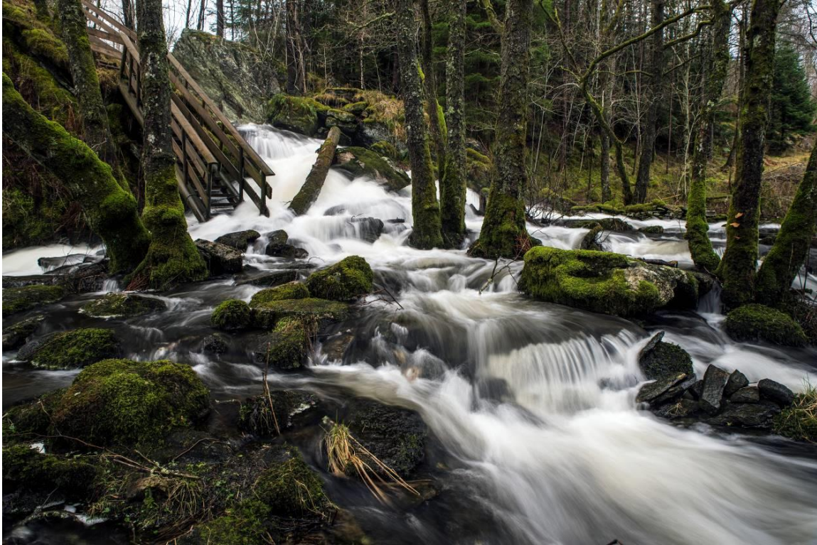
Fossen i Mjåtveitelva.