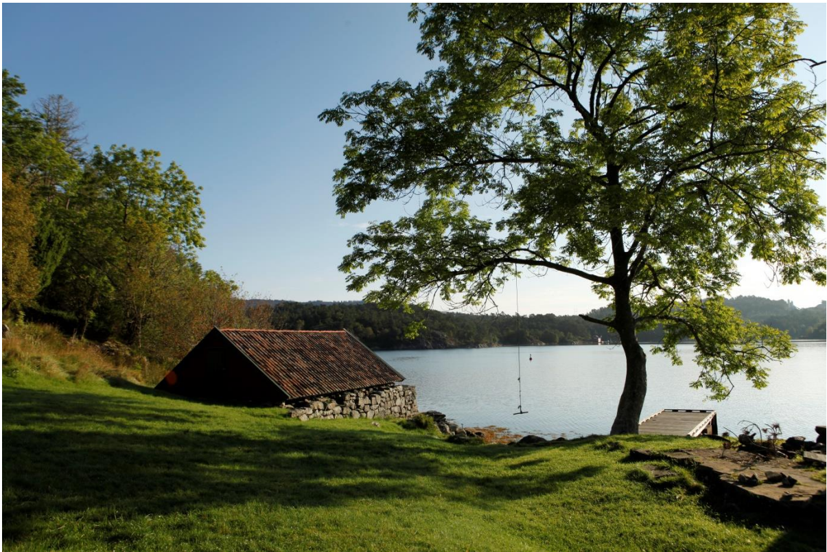
Håøy friområde.

Innfartsparkering på vestsida av E39 ved Norbetong. Stor ny parkeringsplass og busshaldeplass, som gir gode tilhøve for turgåarar mot Håøytoppen.