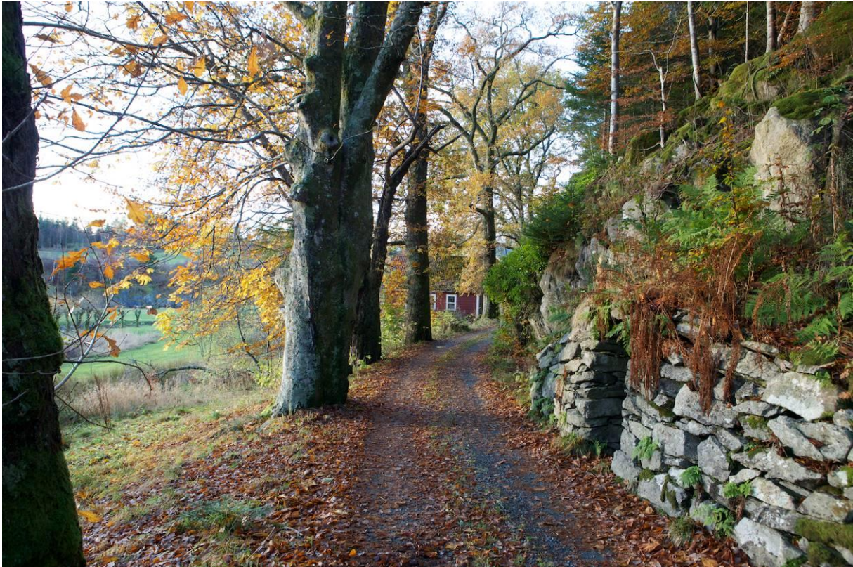
Meland Golf, Leirvik gard.

Parkeringa ved golfbanen vert òg nytta av turgåarar i golf- og naturparken, samt områda rundt Eikelandsvatnet. Det er utviklingsplanar ved golfbanen, som vil kunne medføre større parkeringskapasitet.