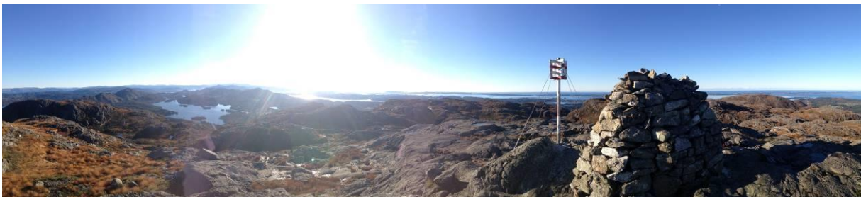
Veten på Eldsfjellet.

Prioritet: Høg – turstien mot Eldsfjellet har høg bruk og potensiale som regionalt turmål. Det er ofte trafikkfarlege tilhøve på store utfartsdagar.