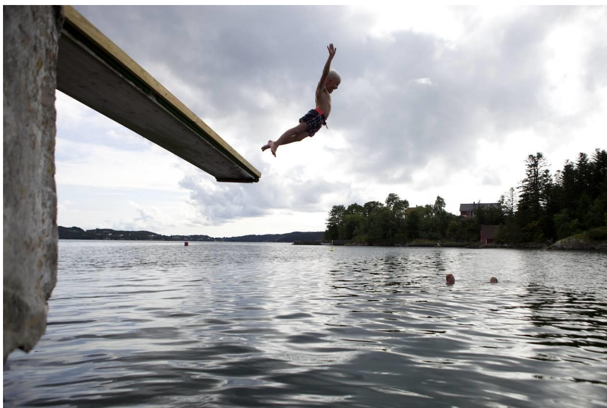
Fløksand friområde.

Prioritering: Middels – høva for reell utbetring avhenger av vegplanarbeidet