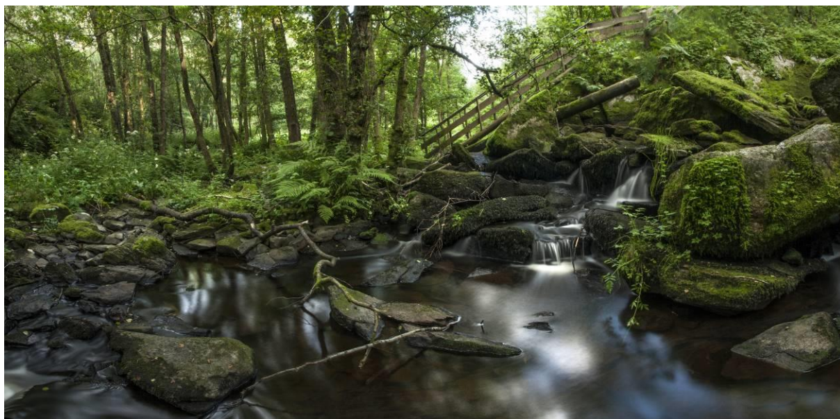
Nedanfor Fossen i Mjåtveitelva.