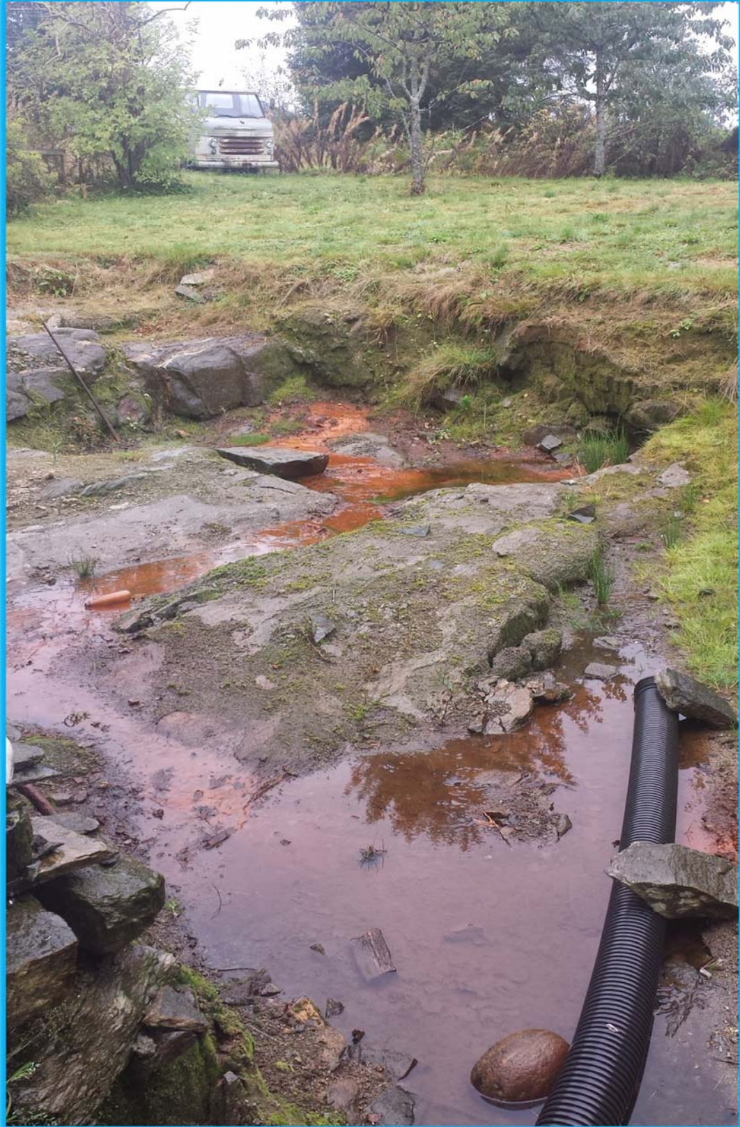
Avdekket område som viser hvordan vannveier, grøfter og annen landbruks infrastruktur er skadet på og mot teigen etter utfylling på nabo tomt.