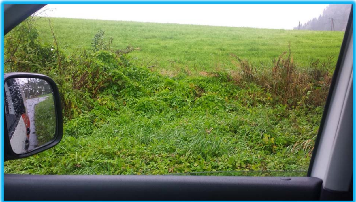
Figur 2 bilde av tydelig forhøyning etter utfylling av langsgående nabotomt i LNF

På denne bakgrunn er det faglig sett riktig å hevde at teigen nå fremstår som en øy eller et helt eget område, mellom en forhøyning og fylling bak og veger og bebyggelse. Derfor finner en det riktig å foreslå teigen som et eget område.