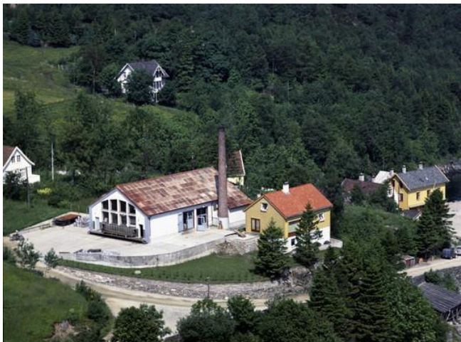
Flyfoto frå Meland 1961-1962