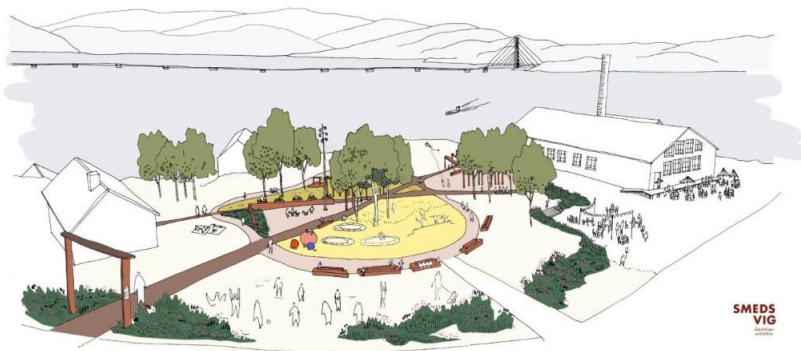
Meieriparken på Frekhaug av Smedsvik Landskapsarkitekter