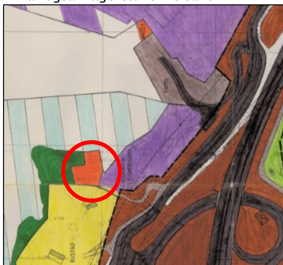
Figur 1: Utsnitt av gjeldande reguleringsplan. Naustområde vist med raud ring.

Statens vegvesen har rett til å uttale seg i dispensasjonssaker som vedkjem vårt saksområde. Vi har også klagerett i slike saker.