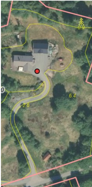
Figur 1 Det vert liggjande att areal aust og nord for den omsøkte tomten, men dette heng saman med teigen som går heilt til kommunevegen

Miljømessige ulemper er til dømes støv, lukt og støy frå landbruksdrifta, og det er eit mål at ein skal førebyggja konfliktar mellom landbruk og busetnad. Ulempene må vera konkret pårekelege og ha ei viss styrke for at dei skal trekkast inn. Ut frå kva som er pårekeleg drift, storleiken på areal og dei topografiske tilhøve ser ikkje kommunen at det gjer seg gjeldande miljømessige ulemper av slik styrke at dei kan vektleggast.