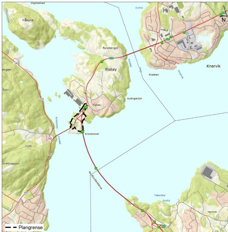
Figur 1.1 Planområdet ligg sør på Flatøy.