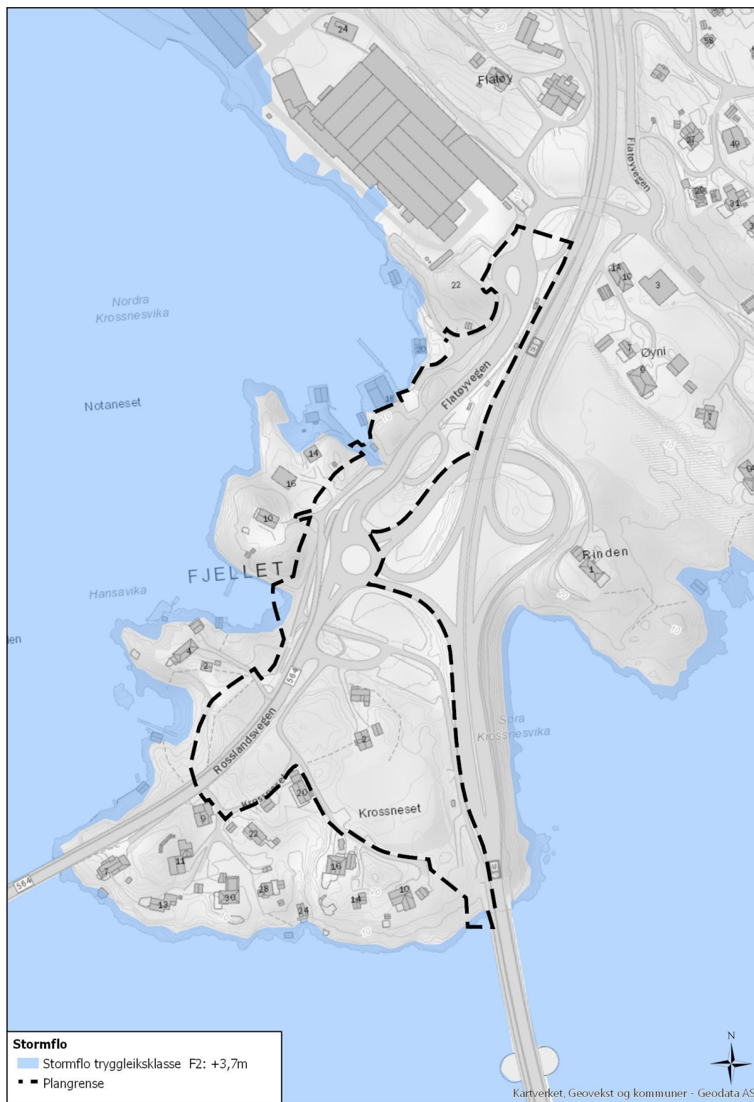
Figur 3.2 Kart over stormflo.