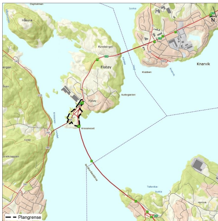
Figur 1.1 Planområdet ligg sør på Flatøy.