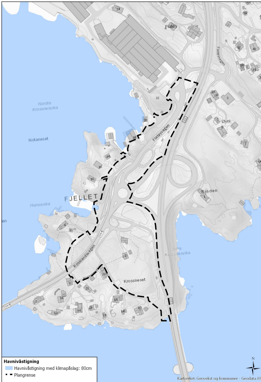
Figur 3.1 Havnivåstigning vil ikkje påvirke tiltaket.