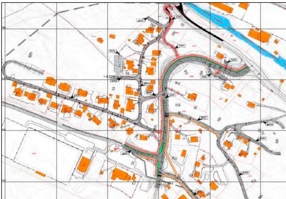
Kart som syner framlegg til nytt vegsystem. Rosslund barneskule ligg like nord for kartutsnittet, medan idrettsanlegget ligg i sør.

Det er fleire fylkesveger innanfor planområdet, både fv. 564 Rosslandsvegen og fv. 248 Eikelandsvegen/levegen. I dag er det ikkje trygt gang- og sykkeltilbod langs desse.