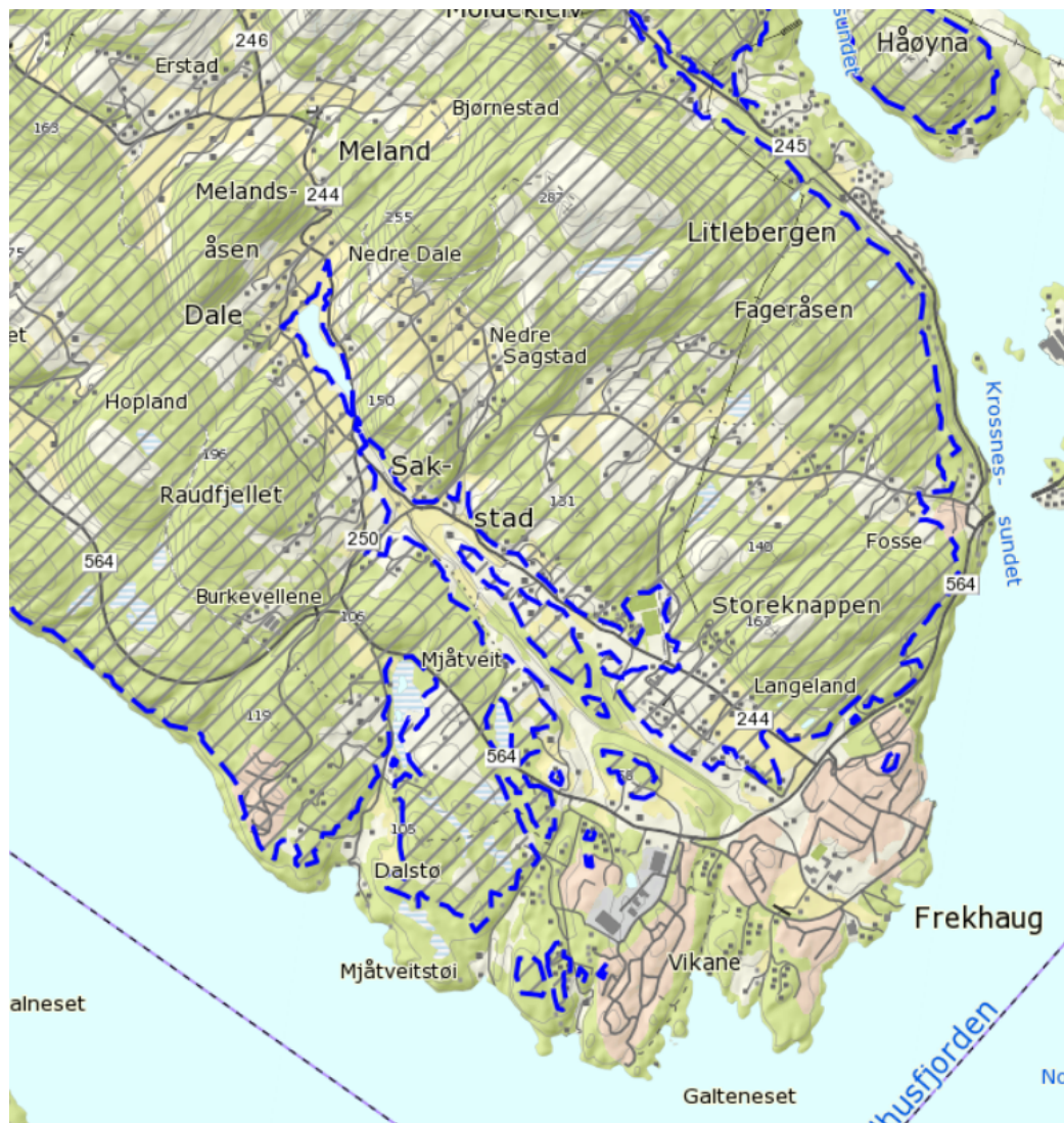
Figur 4 Kart over marin grense (blå strek) og områder over marin grense skarvert område.