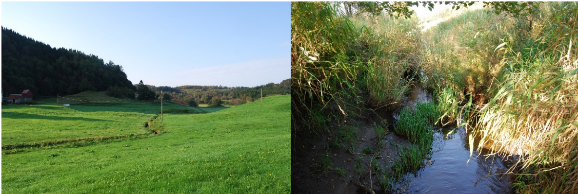
Figur 2 Bekken ved tiltaksområdet tatt ved vegkryss FV244-246 (venstre), Vegetasjon i bekken 100 nedstrøms Kirka,

Det ble ikke observert elvemusling i tiltaksområdet. Det ble heller ikke observert fisk i bekken ved tiltaksområdet. Bekken er tydelig kanalisert og steinsatt i kantene med sand og steinbunn og en del vegetasjon og vannplanter. Det er ingen funksjonell kantvegetasjon som hindrer jordbruksavrenning langs bekken.