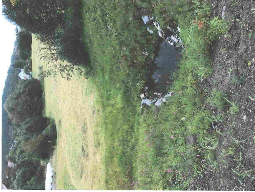
Paktarhusmyra med dreneringsbasseng mot veifylling.