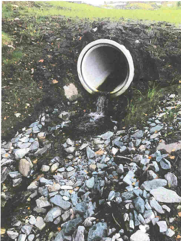
Dreneringsutløp fra Paktarhusmyra i forkant av kisteveiten.