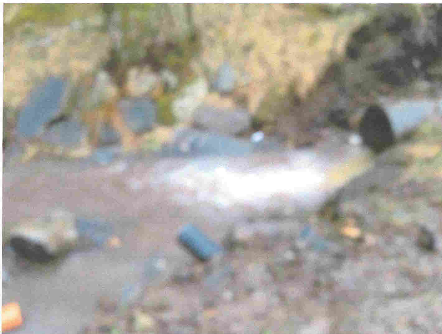
Vannføring etter 6 timers nedbør