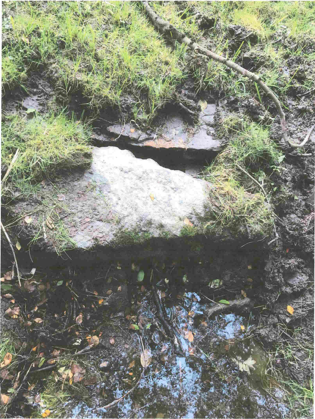
Her er åpningen på kisteveiten som skal sluke unna dette vannet