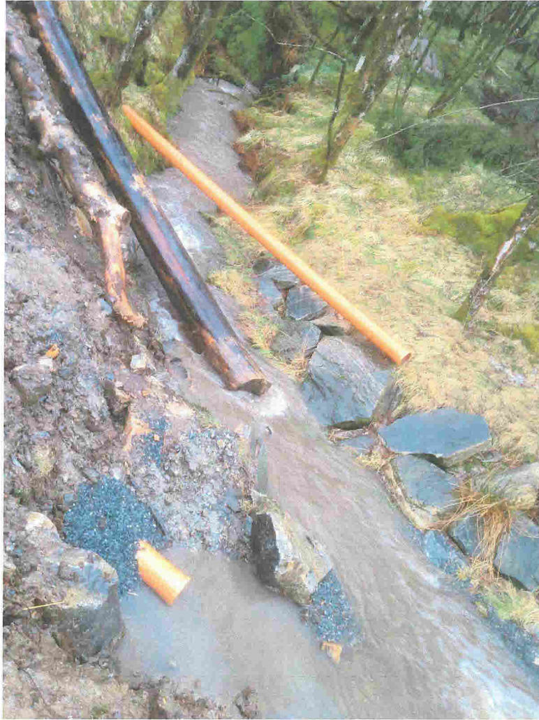
Vannføring etter 6 timer i åpen grøft mellom rør fra Pakterhusmyra og kisteveit