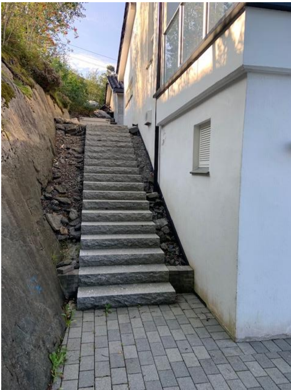
Trapp lang bygg (mot vest)