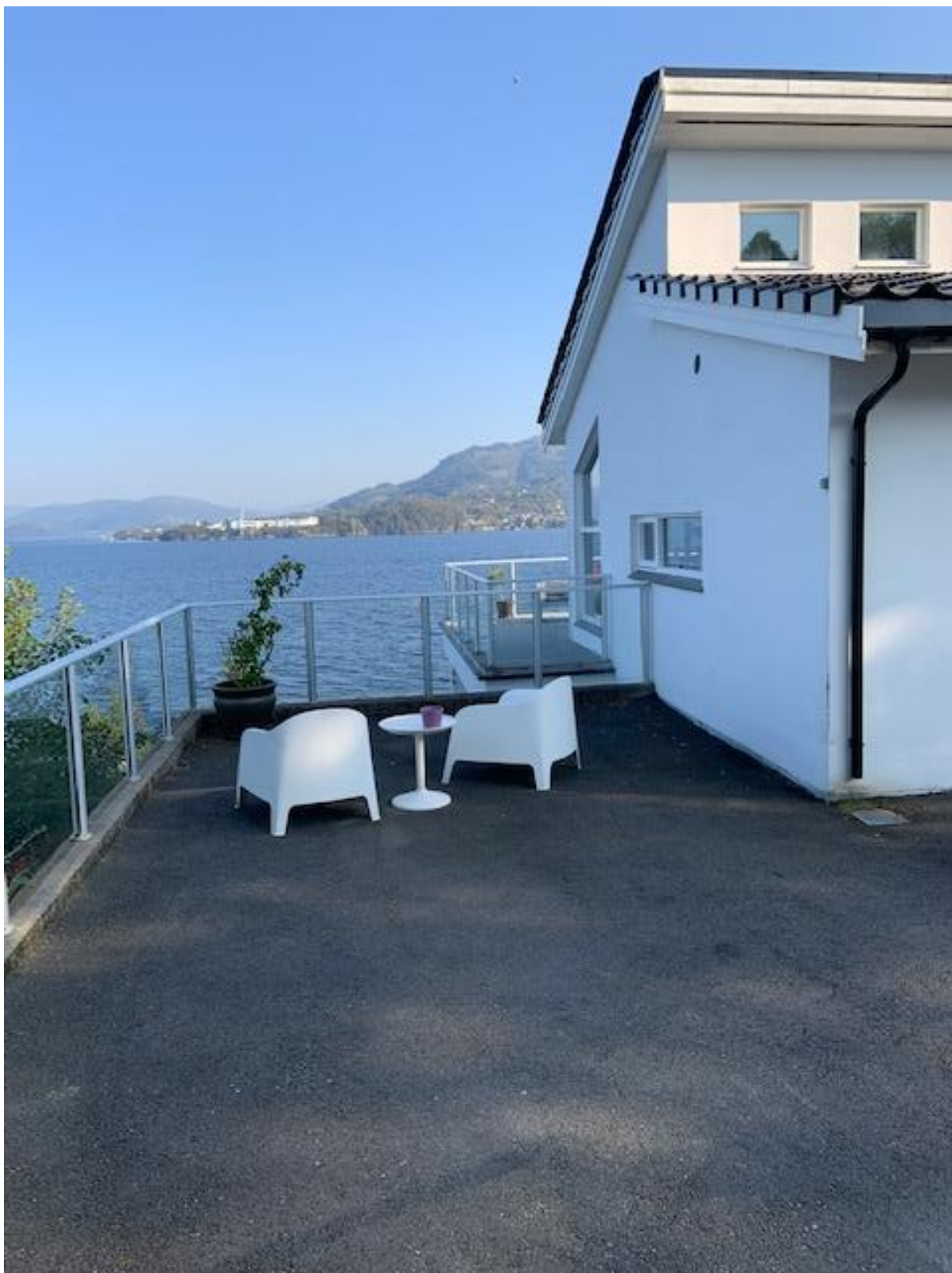
Uteplass med mur langs bygg (møt øst)