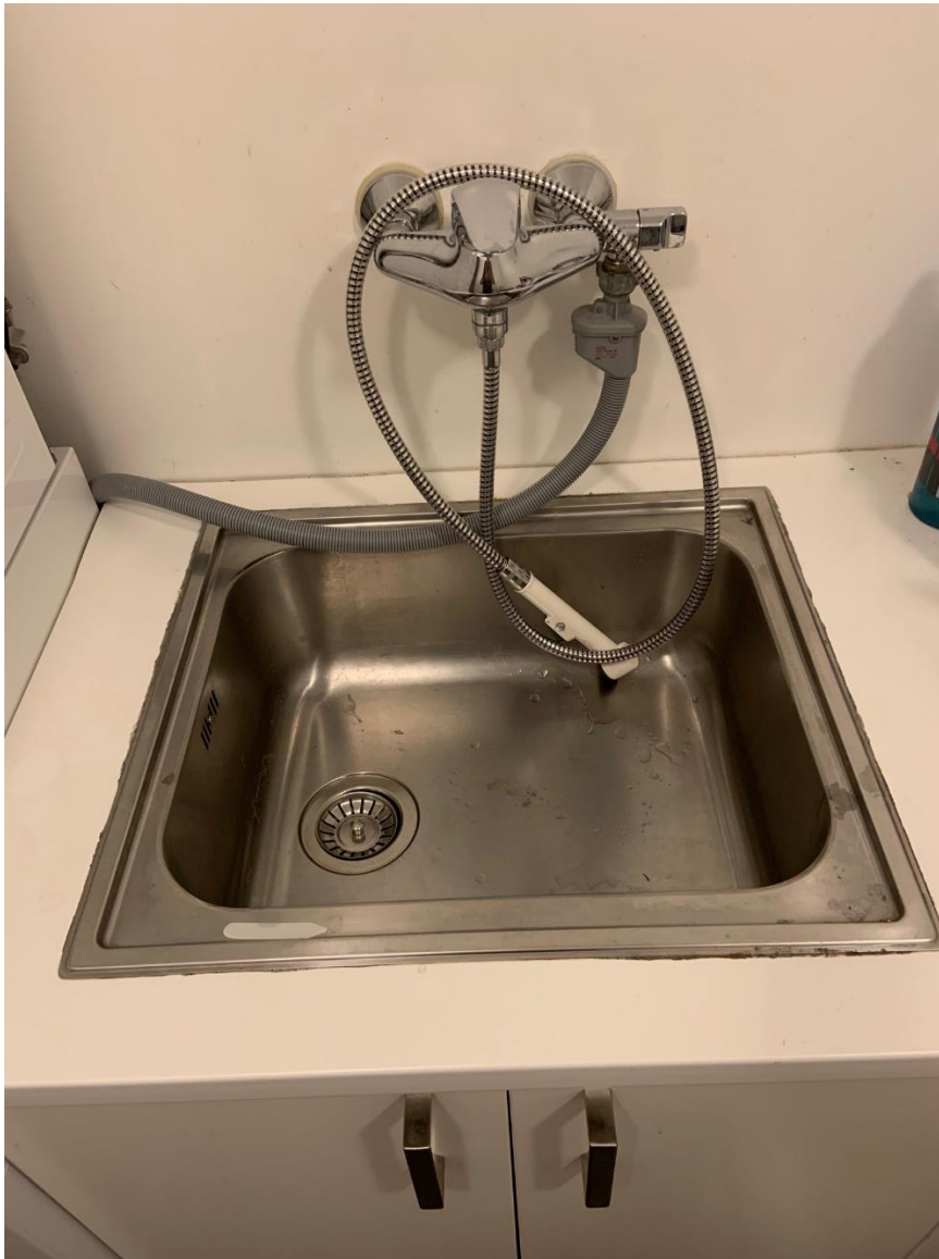
Utslagsvask montert på vaskerom

Bilder som viser ferdigstilling av mangler notert i midlertidig brukstillatelse samt bilder som viser terrengetilpasninger rundt huset som ble foretatt i forbindelse med nybygget.