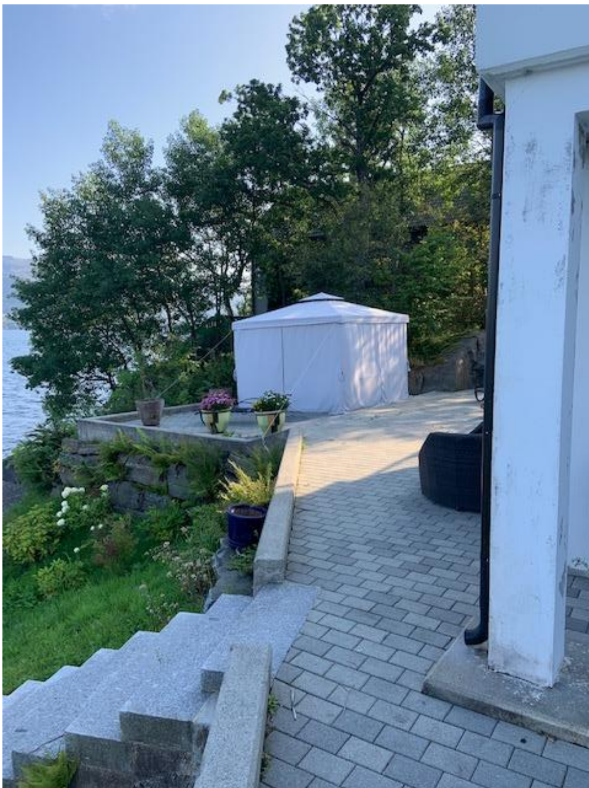
Plassering av septiktank (ligger under kompassrosett foran partyteltet) innenfor sprengstein muren