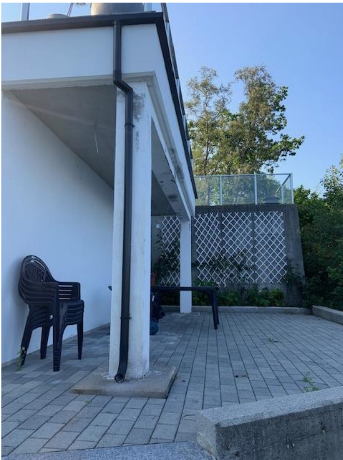
Mur rundt uteplass langs bygg sett fra underetasje (mot øst)