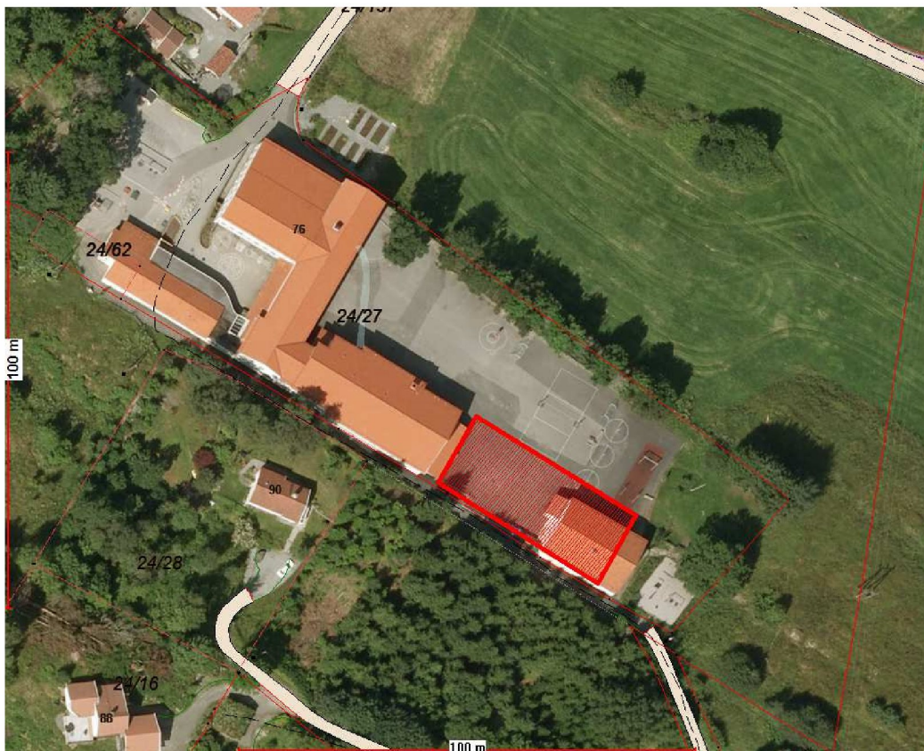
Kart 1: Sagstad skule. Tiltenkt plassering for tilbygg vist i raudt