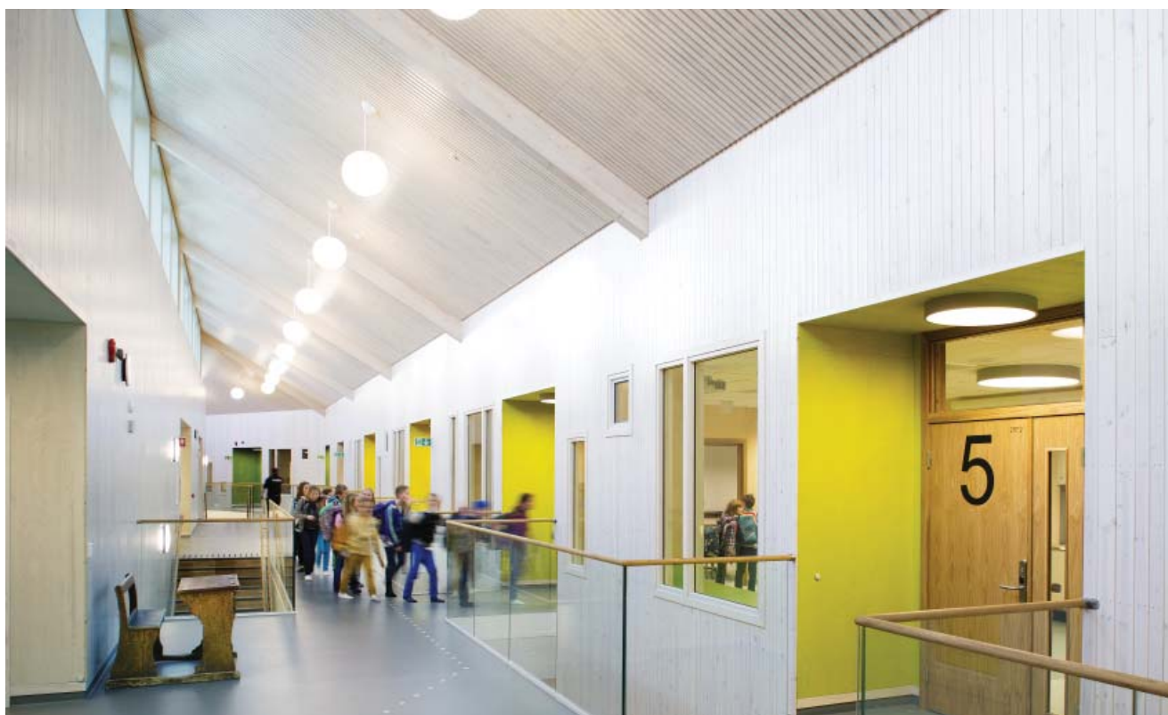
Bilde fra Søreide skole