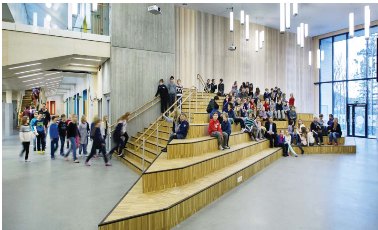
Bilde fra Søreide skole