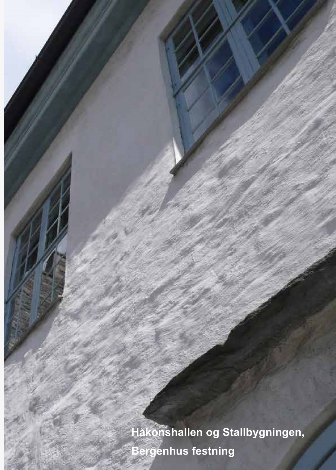
Håkonshallen og Stallbygningen, Bergenhus festning