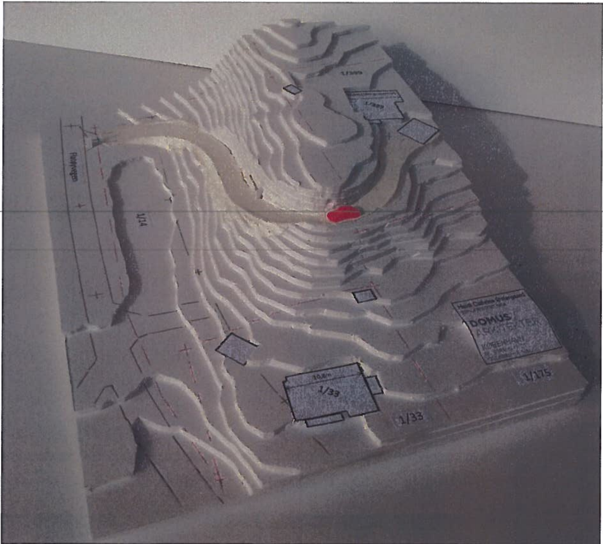
Figur 2: Skalamodell – viser veitrase tenkt fra GBNR 1/399 til Flatøyvegen