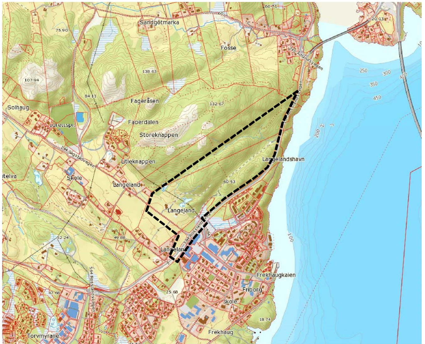
Figur 2. Forslag til planavgrensning, grovt skissert med svart, stiplet linje.