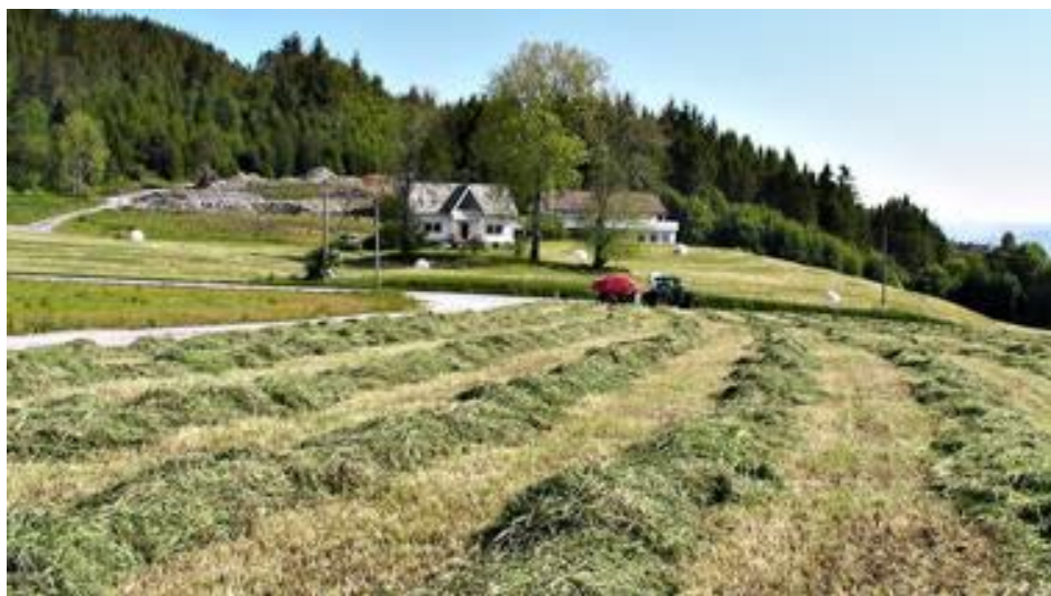
Langeland i Meland kommune ligg på grasavlingstoppen i Noreg.

Korleis nytta massar frå utbygging som ressurs for landbruk og samfunn på ein god måte for innbyggjarar og miljø?