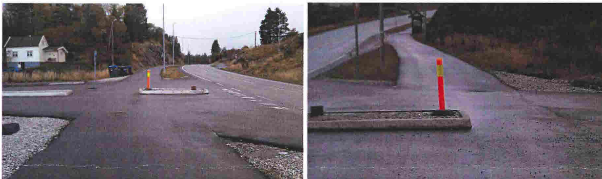
Trafikkøy utgjør hinder og fare, særleg for syklende.