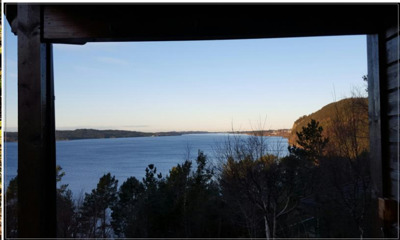
Vår kjære dyrbare utsikt.