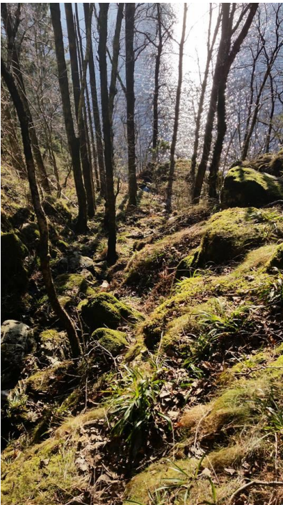
Nedstigning til Trollhola.