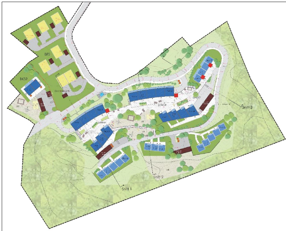
Bilde 1 Revidert illustrasjonsplan for ØVRE HOLSBERGSTIEN, datert 13.11.2015.

Reguleringsplanen for Øvre Holsbergstien legger opp til en utbygging av tomt gnr. 10/ bnr. 40. Formålet er etablering av 56 nye boenheter fordelt på 2- og 4-manns boliger. Reguleringsplanen inkluderer også et byggefelt i nord, merket BFS på illustrasjonsplanen under. Dette feltet har fått tilkoblingstillatelse for VA-anlegget, viser til søknad om sanitærabonnement av 01.07.2015.