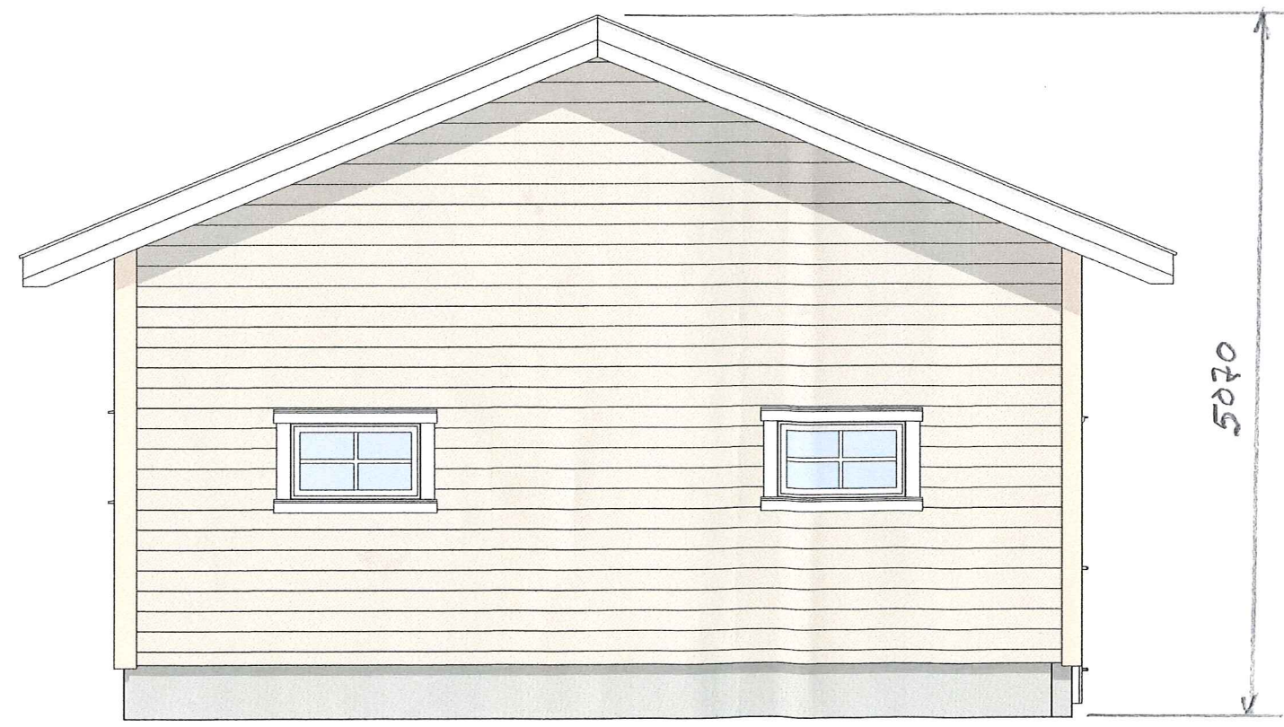
1:50 Fasade Nord