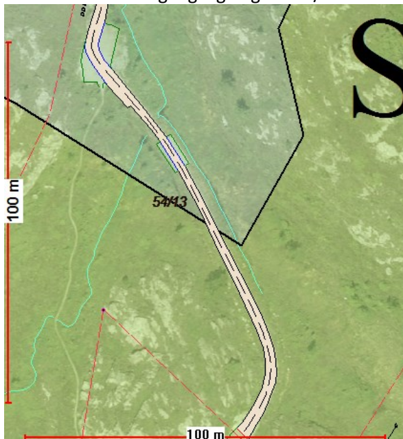
Nr 1: Eksisterande gangveg til gbnr 54/35: