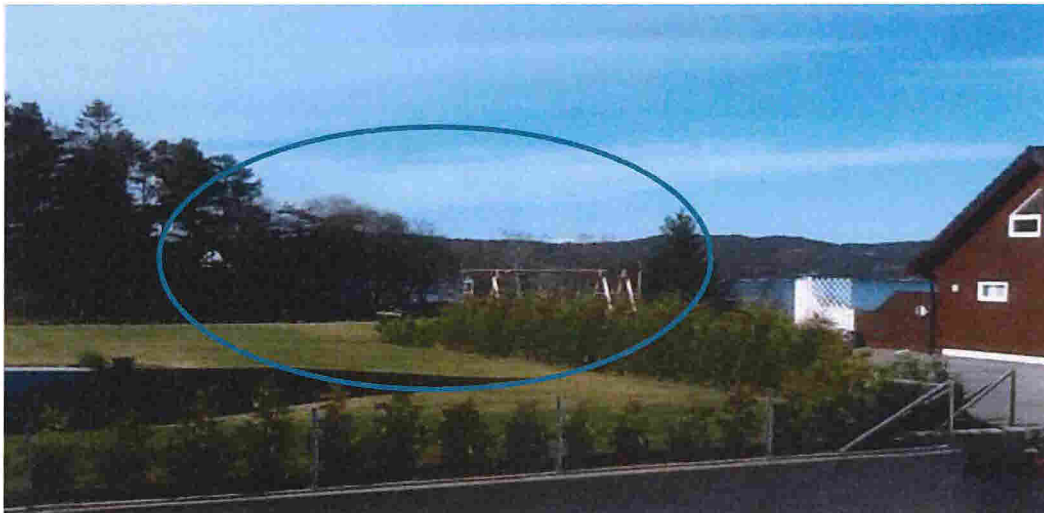
*Kopi av bilde fra naboklage 10/90

På utsiktspildene som nabo viser til vil ikke garasjen sperre deres utsyn i så stor grad som det blir gjort inntrykk for (all utsikt til sjø). En kan fra bildene se at det er en del vegetasjon som sperrer deres utsikt og dette er vegetasjon som vi ikke eier (hekk og trær) og dessverre ikke kan gjøre noe med.