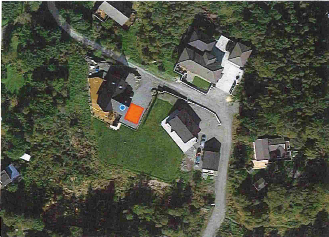
*Flyfoto fra «Google Maps» over tomt og gruset biloppstillingsplass.

På utsiktspildene som nabo viser til vil ikke garasjen sperre deres utsyn i så stor grad som det blir gjort inntrykk for (all utsikt til sjø). En kan fra bildene se at det er en del vegetasjon som sperrer deres utsikt og dette er vegetasjon som vi ikke eier (hekk og trær) og dessverre ikke kan gjøre noe med.